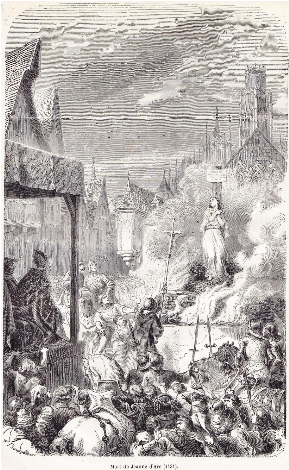
Mort de Jeanne d'Arc (1431).